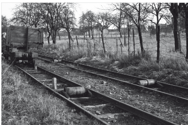
2 Die Wagen erreichen das Land unter der Burg