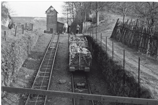
1 Ein Doppelgespann auf dem Weg zum Stürzberg