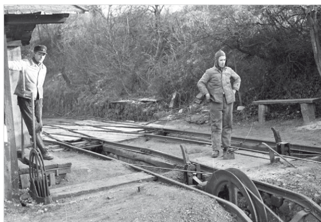
6 Bremsen und Gucken, ansonsten „hilflos“