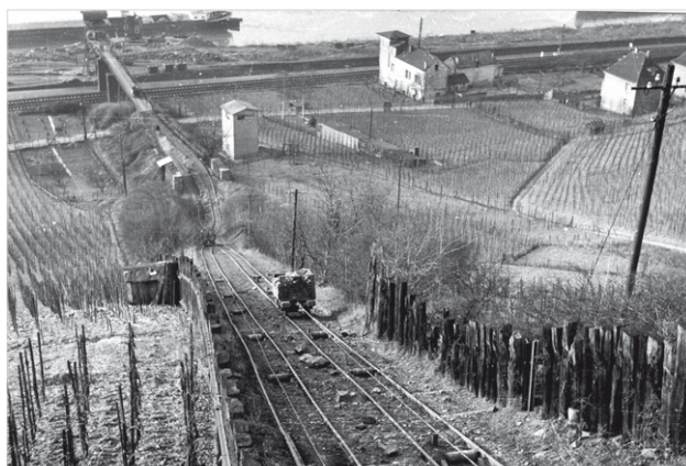
8 Ein beladener Wagen zieht den bereits sichtbaren, leeren ohne Probleme bergauf, rechts Palisaden