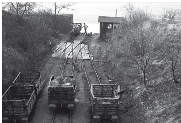
7 Wagen werden vorsortiert für die Steilstrecke, vorne ein Schutzhäuschen für die Arbeiter mit schöner Aussicht