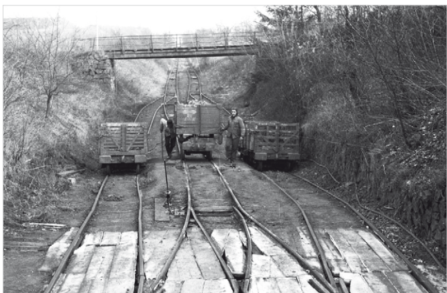
3 Angekommen am „Plateau Stürzberg“ - rechts in den Hängen wurden die Gräber aus fränkischer Zeit entdeckt