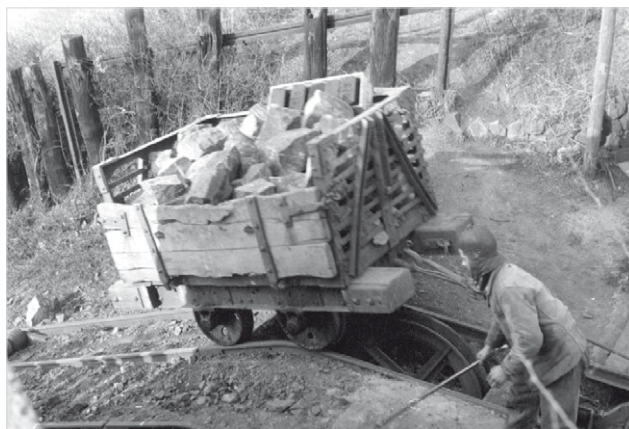
5 Der Wagen wird über die Kippe geschoben