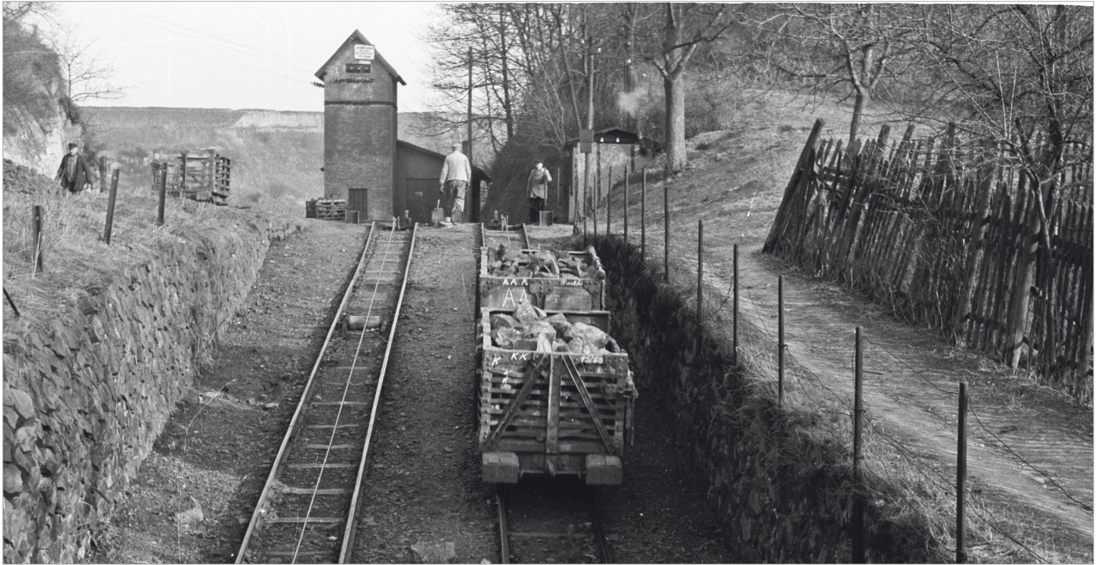
Transport mit der Bremsbahn - 1. Abschnitt Eingang Bruch bis Stürzberg Hier wird soeben ein Doppelgespann auf die Reise zum Stürzberg geschickt.