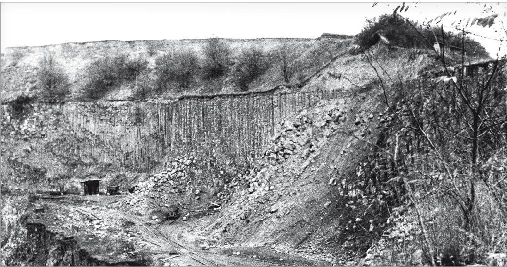
Säulenbasaltbruch in Dattenberg Abbaustelle an der Rundbahn im fast ausgebeutetem Zustand, über dem Steinstand Kiesschicht (Rheinterrasse), Aufwuchs: eine Weidenart (nach rechts oben Weg zum Heisterer Heiligenhäuschen)